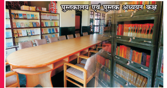
पुस्तकालय एवं पुस्तक अध्ययन कक्ष

वैदिक अनुसन्धान को प्रोत्साहित करने के उद्देश्य से अध्येतावृत्ति का प्रावधान है। इस प्रयोजन के लिये प्रतिष्ठान में एक व्यापक अध्येतावृत्ति योजना चलाई जा रही है। इस योजना का प्रमुख उद्देश्य विद्वानों को, विशेष रूप से युवा शोध छात्रों को, अवसर प्रदान करके वेदों तथा वैदिक साहित्य के विभिन्न पक्षों पर अनुसन्धान को बढ़ावा देना है ताकि वे अनुसन्धान-परियोजनाओं में पूर्णकालिक आधार पर अपने चयनित शोध विषयों पर गंभीर गवेषणा-कार्य कर सकें।