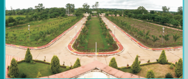
प्रतिष्ठान के वैदिक उद्यान

प्रतिष्ठान द्वारा घर बैठे वेदों की शिक्षा का पत्राचार पाठ्यक्रम प्रारम्भ किया गया है। इसमें उत्तीर्ण वेदानुरागियों को 'वेद निपुण' प्रमाण-पत्र प्रदान किया जाता है। इस योजना के अन्तर्गत जनसामान्य को चारों वेद, वेदाङ्ग, ब्राह्मणग्रन्थ, आरण्यक, उपनिषद्, भारतीय संस्कृति का स्वरूप एवं महत्त्व, भारतीय दर्शन शास्त्र की सामान्य जानकारी जन-जन तक पहुँचाने के उद्देश्य से पाठ्यक्रम को मूर्त रूप दिया गया है। पाठ्यक्रम को रुचिकर बनाने के लिए वैदिक आख्यानों एवं गाथाओं को भी यथास्थान प्रस्तुत किया गया है। उक्त पाठ्यक्रम को हिन्दी अथवा अंग्रेजी माध्यम से किया जा सकता है।